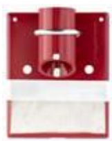
Figur 1: Skilt med dreibart siktemerke

Skilt monteres i høyde 2.0-2.2 m og "over ett merket" skal være lesbart fra kummen.