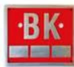
Figur 2: Fast kumskilt