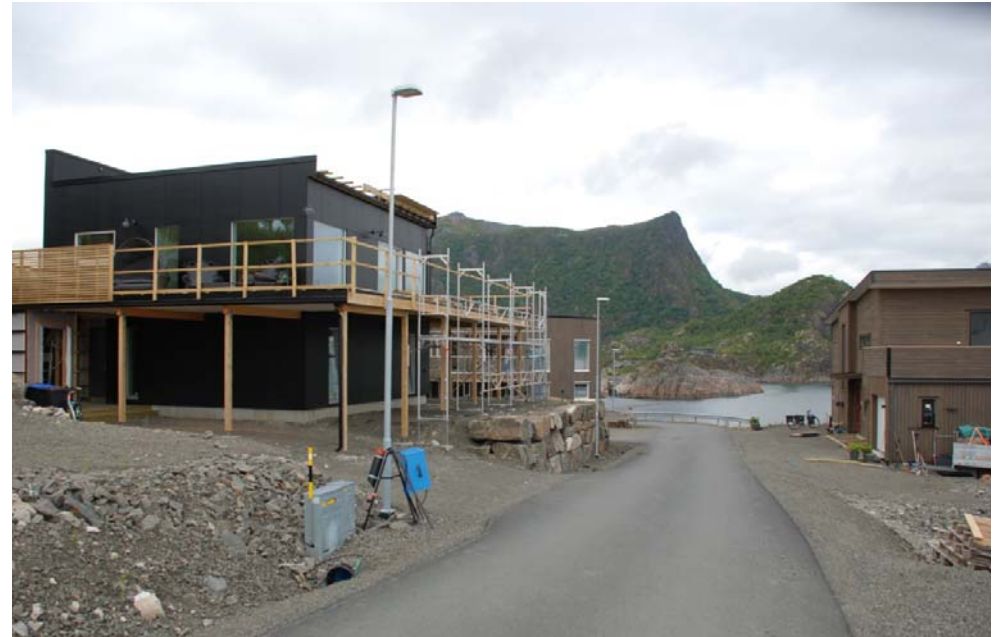
Pågående utbygging på Kreta med modernistisk arkitektur

Notat om arkitektur og byggeskikk i området rundt Smedvika