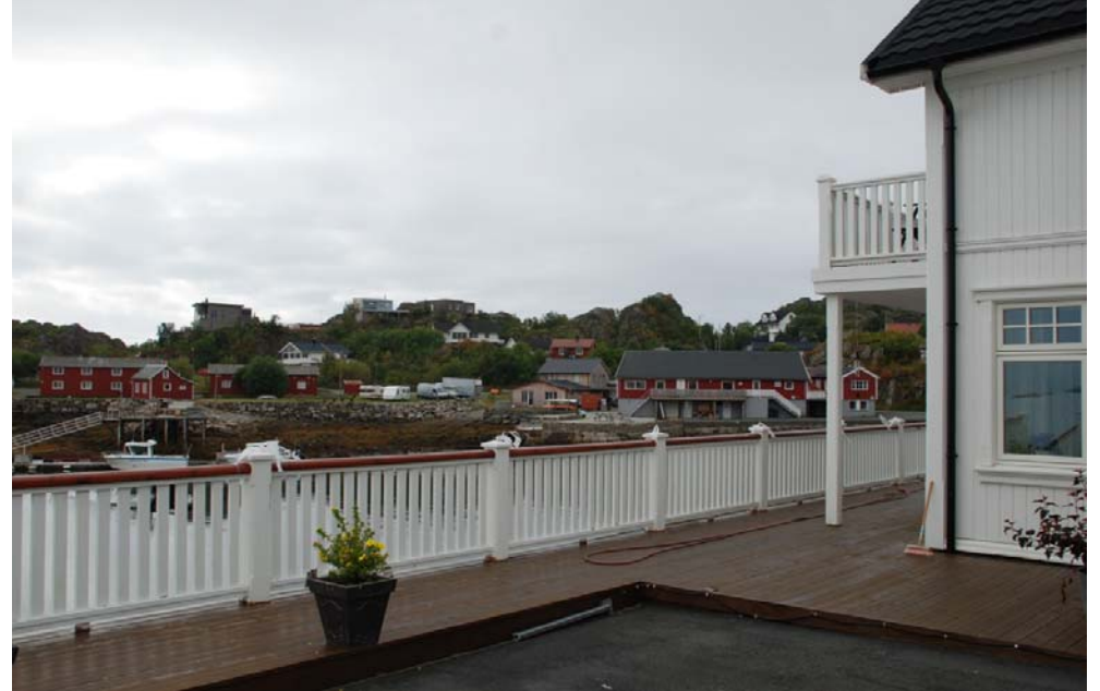
Tollefsneset utbygging i "nostalgisk stil" rundt 2010

Notat om arkitektur og byggeskikk i området rundt Smedvika