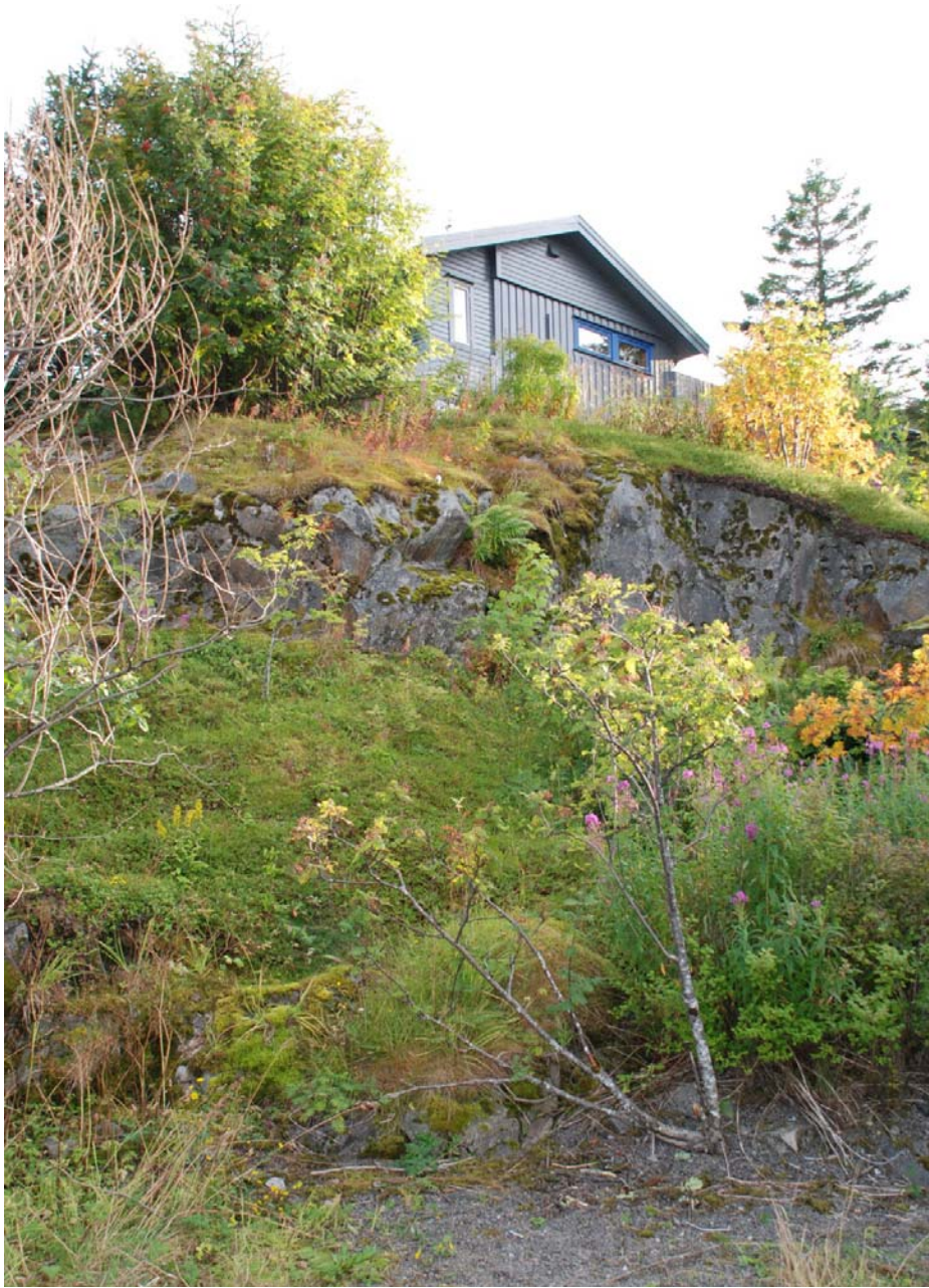
Vikabakken 11 typehus fra midten av 1970-tallet