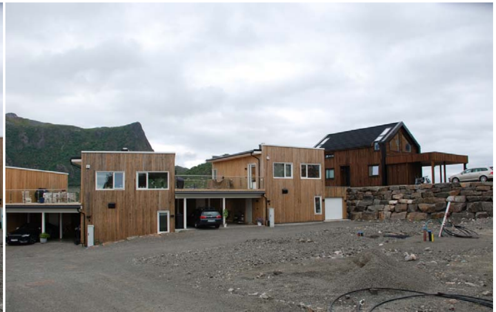
Pågående utbygging på Kreta med modernistisk arkitektur

Notat om arkitektur og byggeskikk i området rundt Smedvika