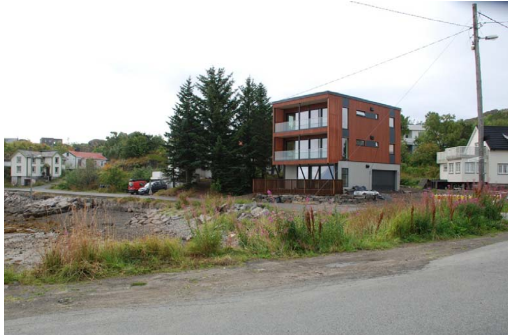
Sørenskrivergata 12 et nybygg fra 2019

Notat om arkitektur og byggeskikk i området rundt Smedvika