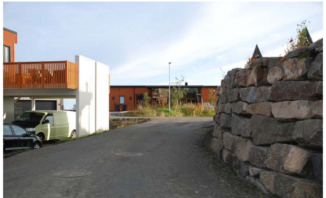
Ursvika boligfelt Nakken øst med modernistiske hus (under utbygging)

Notat om arkitektur og byggeskikk i området rundt Smedvika