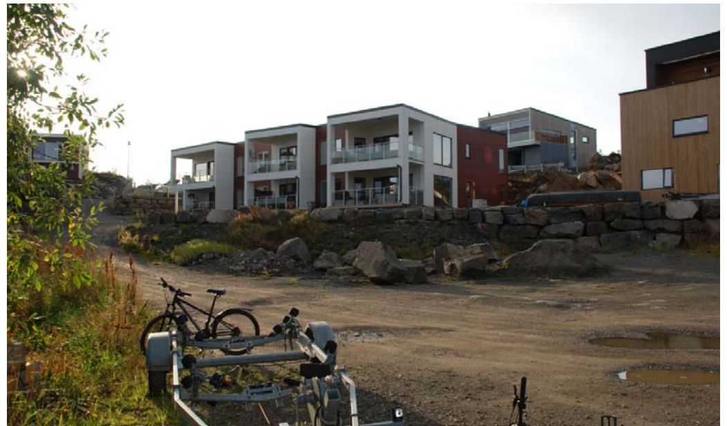
Ursvika boligfelt Nakken øst med modernistiske hus (under utbygging)

Notat om arkitektur og byggeskikk i området rundt Smedvika