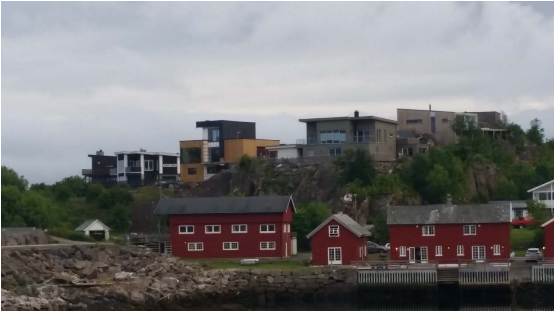
Den modernistiske bebyggelsen på Nakken øst preger silhuetten på sørsiden av Smedvika.

Notat om arkitektur og byggeskikk i området rundt Smedvika