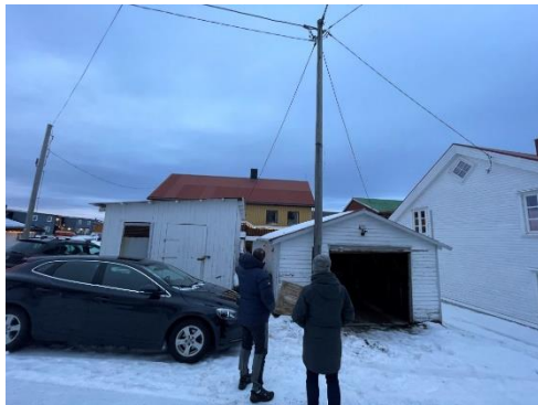
Utbedring av garasje, Hellandsgata 47