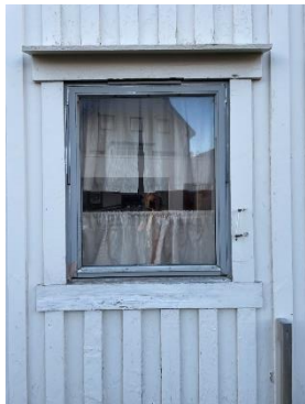
Enøk, Dreyers gate 69

Ved befaring har kulturminnemyndigheten hatt særlig søkelys på hvilke deler av ønsket tiltak som kan kvalifisere til tilskudd under post 71, og anbefalt eiere å søke om tilskudd i de tilfeller det er relevant. Det er også gjennomført flere befaringer i forbindelse med pågående og fremtidige byggesaker.