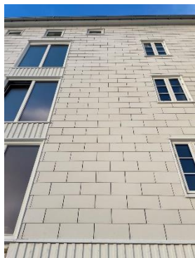
Ny fasade Salteriet