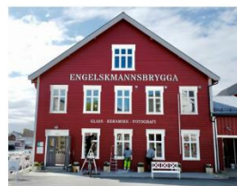
Rehabilitering av vindu, Engelskmannsbrygga - har fått tildelt midler under post 71.

Det er viktig å få frem hvorfor prosjektet har antikvariske verdi, og vil bidra til Henningsvær fredet kulturmiljø i sin helhet.