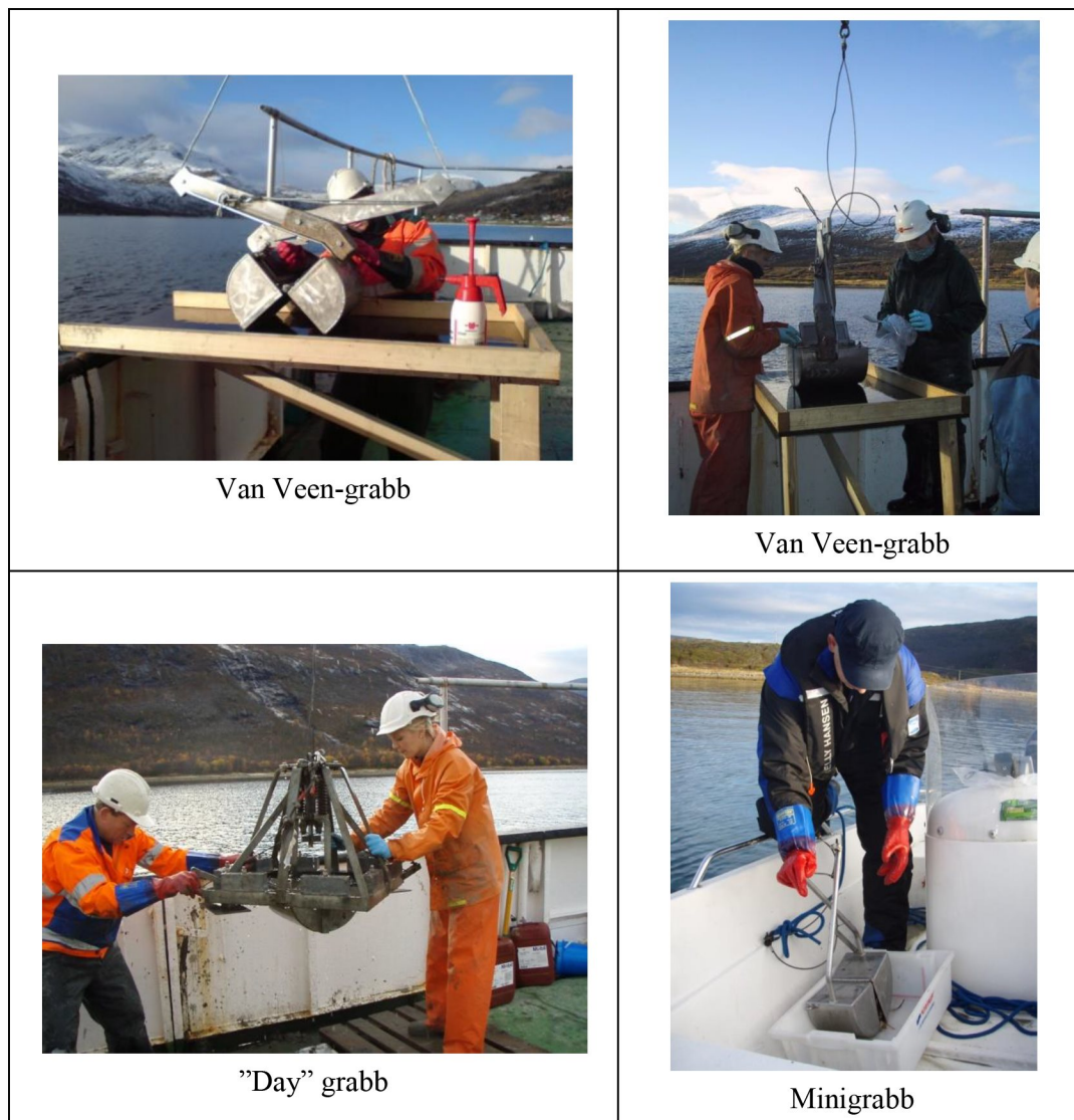
Figur 2 Standard van Veen-grabb med «inspeksjonsluker» hvor prøver blir tatt ut, «day» grabb på stativ og håndholdt minigrabb.

Multiconsult har flere standard van Veen-grabber og minigrabber i tillegg til en større grabb på stativ («day» grabb). Prøveinnsamling kan utføres med en av disse grabbene, avhengig av bunnforhold og tilgjengelighet for prosjektet. Grabbene er vist i figur 2.