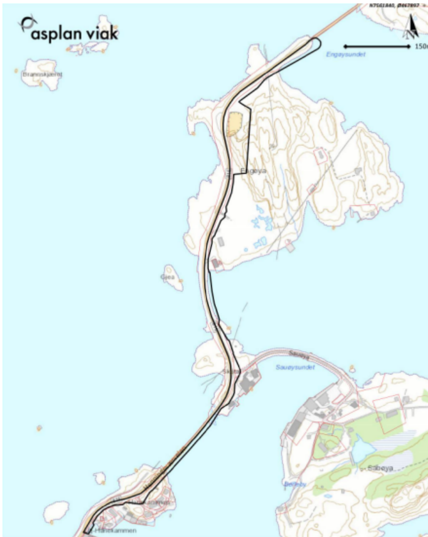
Figur 1 Planavgrensning ved varselet om oppstart av planarbeid (Asplan viak)