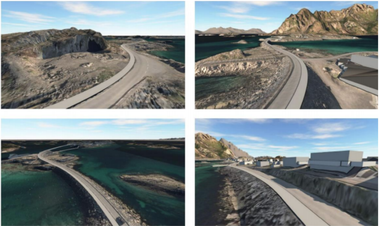
Figur 2 3D-visualisering av foreslått løsning for fortau.