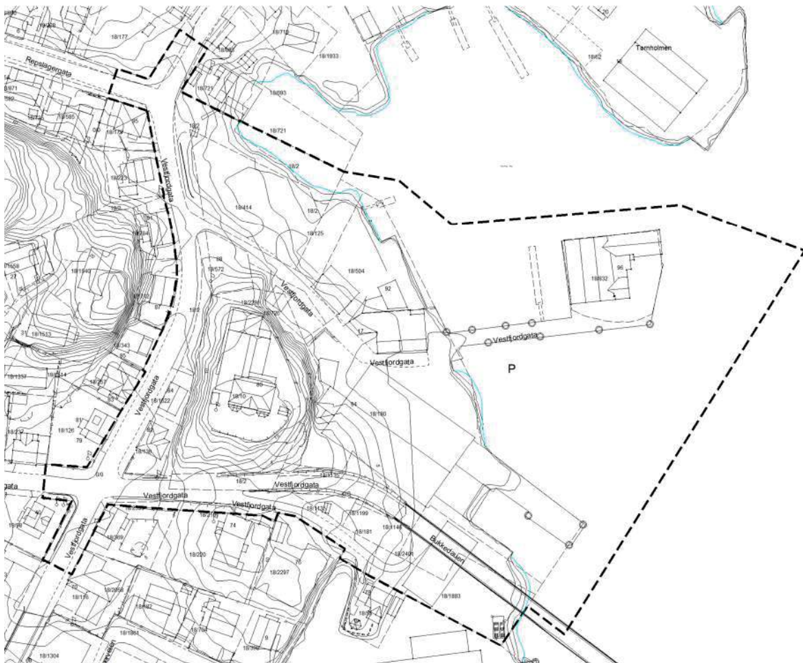
Figur 2 Forslag til planavgrensning

I kommuneplanen er det satt krav om en helhetlig planlegging for et større område enn det disse tre eiendommene omfatter. Avgrensingen er gjort i samarbeid med Vågan kommune.