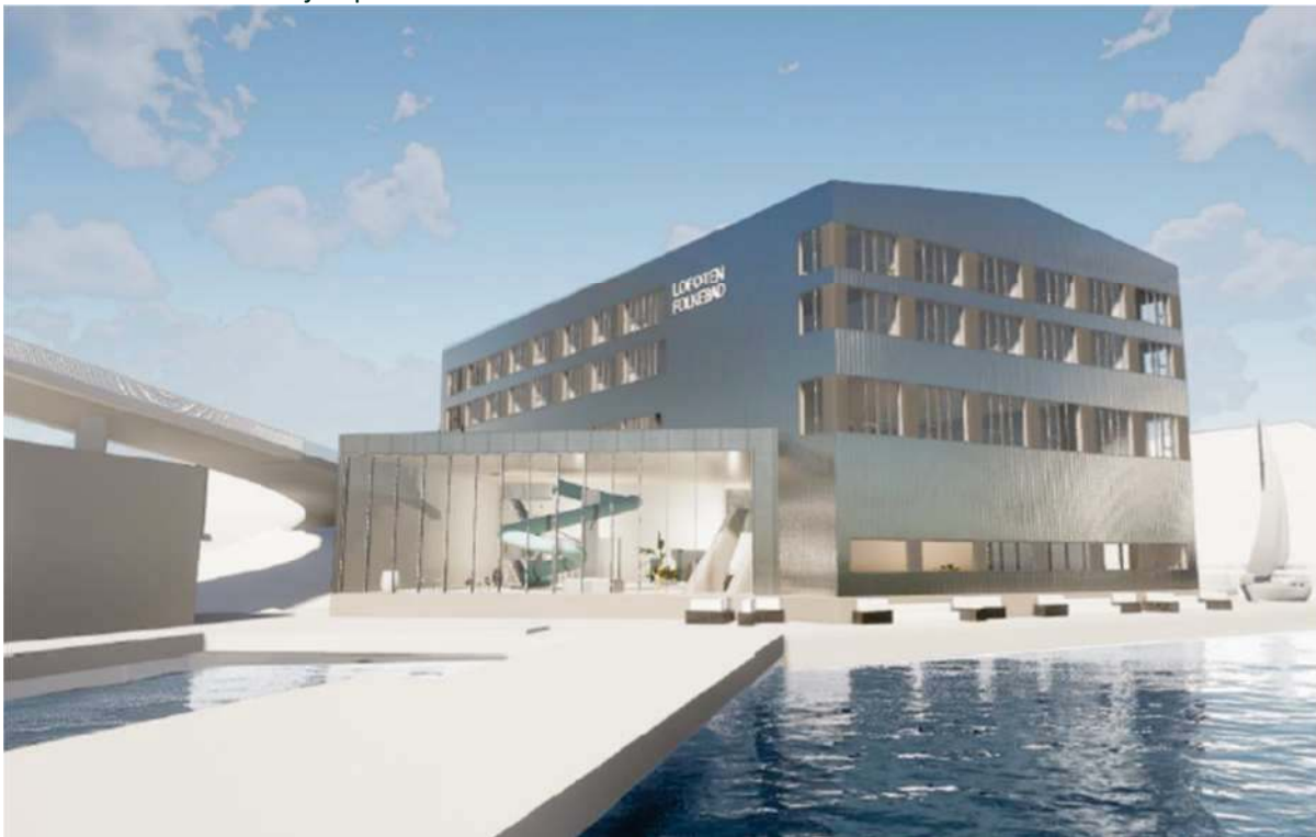
Figur 3 Illustrasjon av Lofoten folkebad

Under vises en illustrasjon på hvordan Lofoten folkebad kan bli