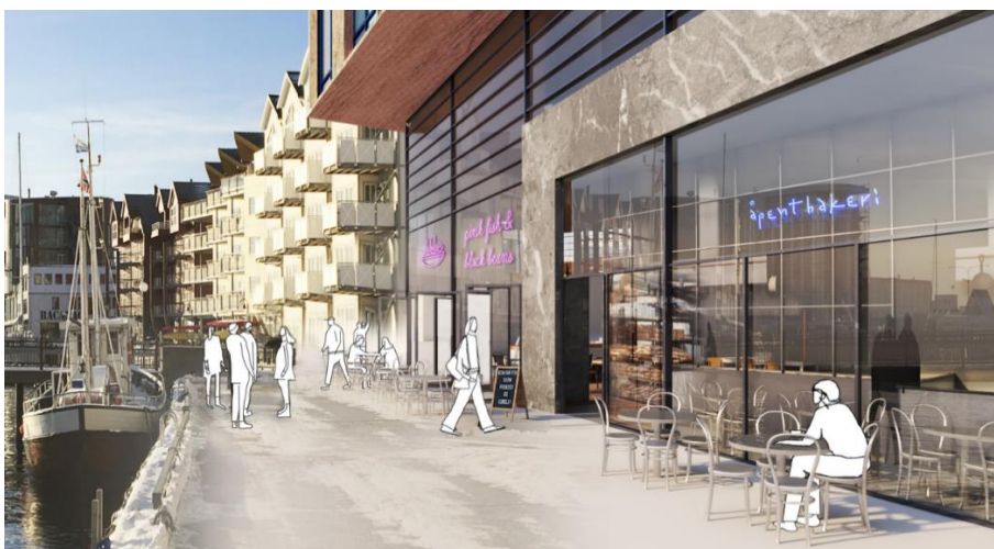
Figur 3 - Illustrasjon av ny bebyggelse langs kaia mot sør

Hotellvirksomhet, med strategisk plassering i bystrukturen, vil kunne bidra som generator for aktiviteter og annen næring i byen. Det vil både tiltrekkes borger som vil nyte godt av oppholdsrom og bevertning samt hotellets plassering, ferieturister samt konferanseturister. Det er ofte stor aktivitet på sjøen utenfor havna, noe som bidrar positivt i dannelsen av byrom og som generator for aktiviteter og kultur i sentrum. Det foreslåtte prosjektet på Havnestrøket og Thon Hotell vil begge være godt synlige orienterings-punkter som sammen vil danne en ramme for dette publikumsrettede området av Svolvær.