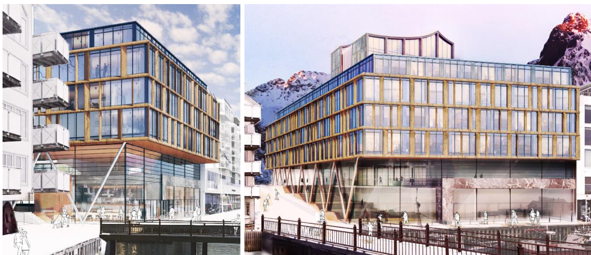
Figur 1 - Perspektiver fra Havnebassenget / sør (tv) og fra Lamholmen / sørøst

Planforslaget bygger på forslagsstiller intensjon om å utvikle Havnestrøket med en kvartalsstruktur som også innebærer en inntrukken bebyggelse opptil kote +44 med inngang fra Vestfjordgata. Bakgrunnen for etablering av bygningen er å innpasse et driftseffektivt hotell med minimum 200 rom med høy kvalitet, konferanseavdeling, samt restaurant i toppen. Det foreslås reguleringsformål sentrumsformål, og vil romme hotellvirksomhet både i den høysete bygningskroppen, og mye av den lavere omkringliggende kvartalsstruktur. Forretning/ bevertning/ servering og kontorvirksomhet foreslås i de laveste etasjene.