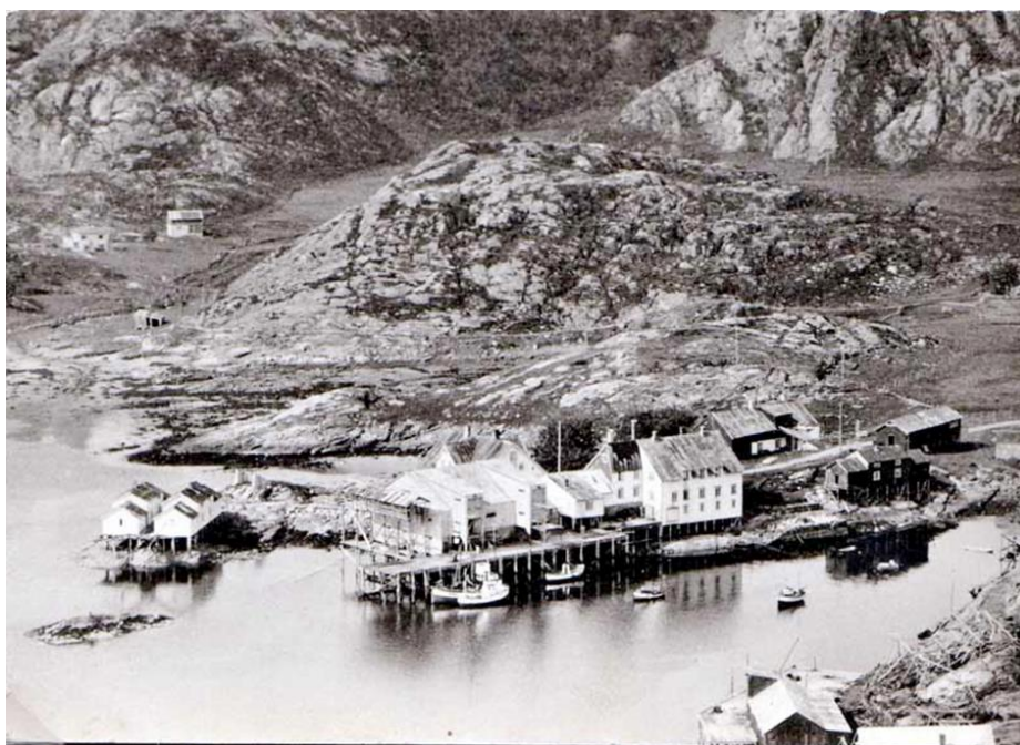
Ørsnesvika og krambuodden, fra tidligere fiskemottak og kaviarfabrikk.

Området er lite bebygget i dag, med kun et par eldre bolighus, og noe spor etter tidligere næringsvirksomhet knyttet til fiskeri på området.