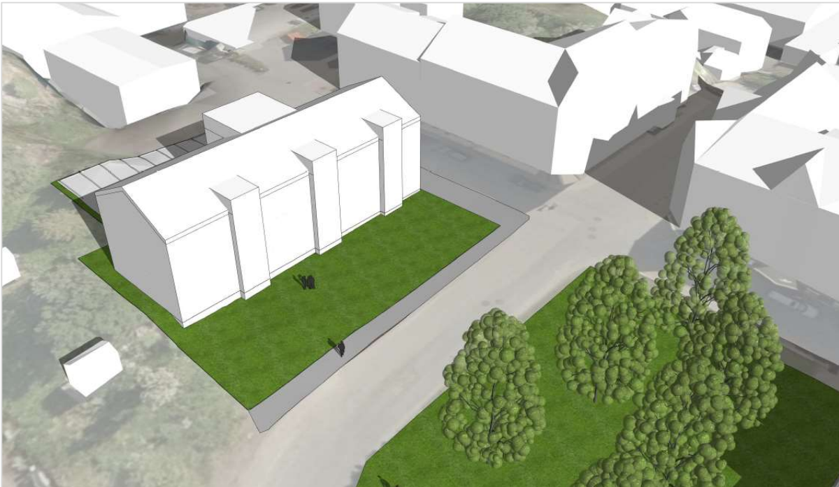
Figur 4: Perspektiv (sett fra nordvest).