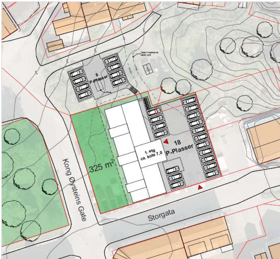
Figur 3: Illustrasjon som viser mulighet for å etablere ekstra parkeringsplasser mot nord. Utarbeidet av Norconsult.

Da verken gjeldende kommuneplan eller -delplan stiller spesielle krav til avfallshåndtering, tenkes det tradisjonell avfallshåndtering med containere og avfallsrom.