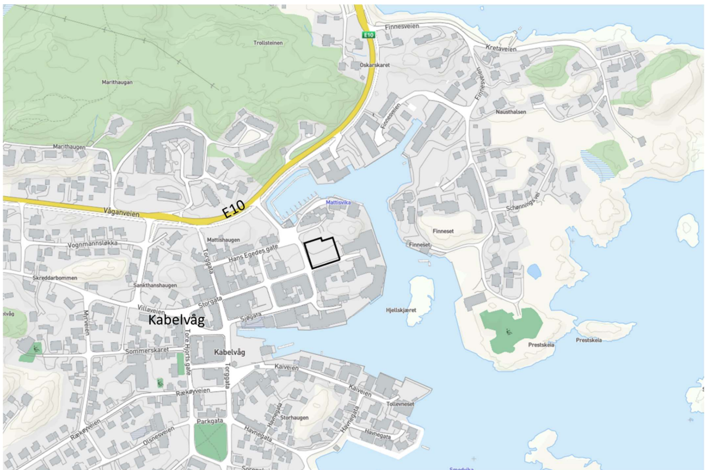
Figur 1: Planområdets beliggenhet. Planområdet vist med svart linje. Kartgrunnlag: kommunekart.com, bearbejdet av Norconsult.

Planområdet som er på ca. 1,7 daa og omfatter gnr. 13 bnr. 325, samt umatrikulert grunn (deler av Storgata) og ligger i Kabelvåg. En liten del av gnr. 13 bnr. 30 og 182 (som i dag er regulert til offentlig parkeringsplass) er også tatt med for å rydde opp i gjeldende reguleringsplan.